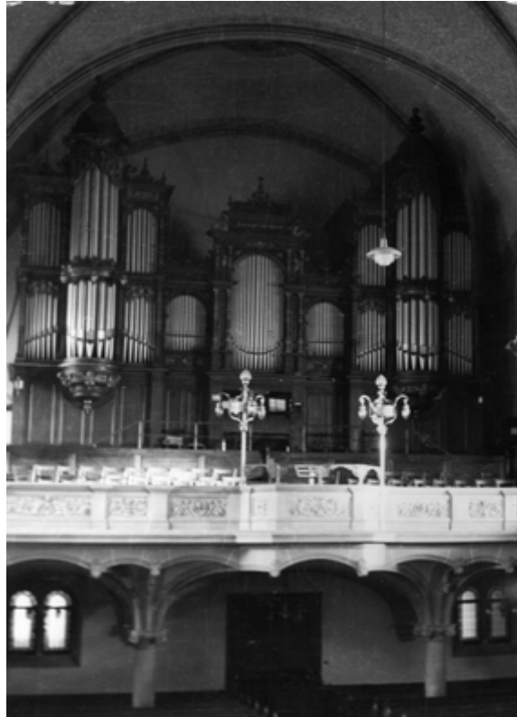
Auszug aus Opusbuch Walcker